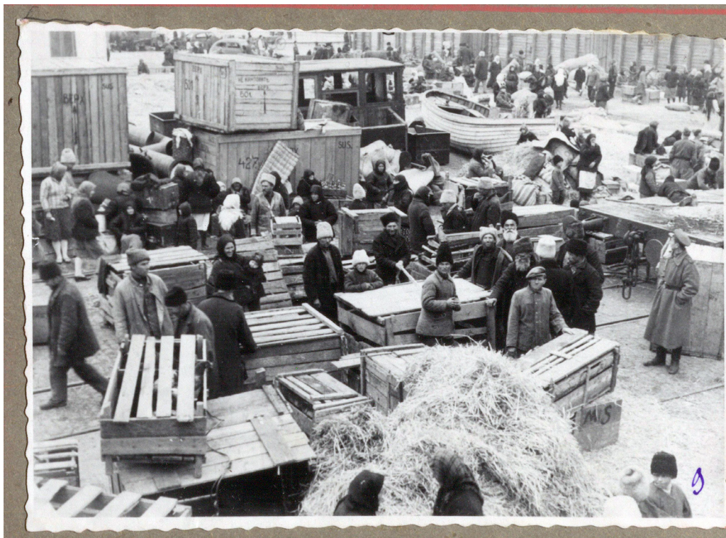
Рисунок 10. Старообрядческие семьи в ожидании погрузки