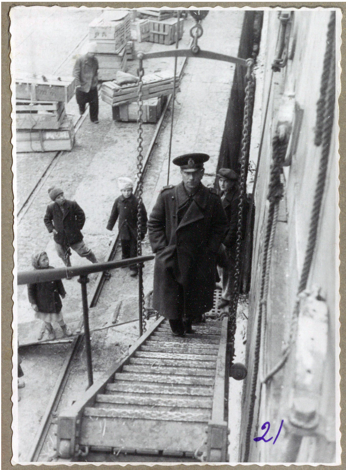
Рисунок 26. Загрузка близится к завершению. Капитан садится на борт «Карла Маркса»