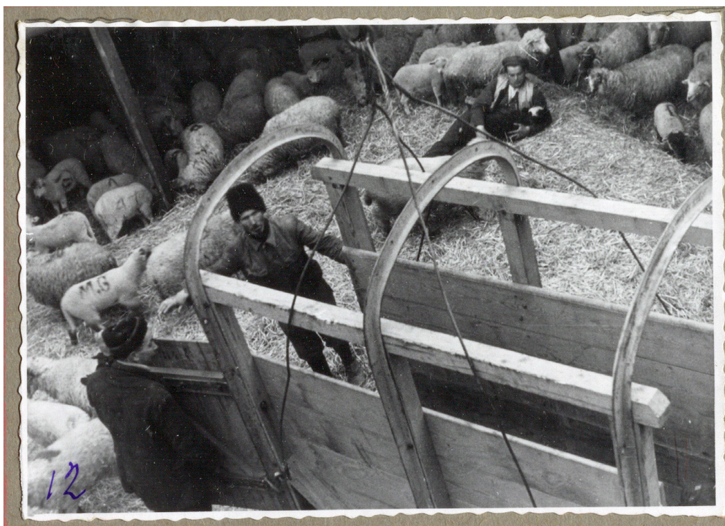
Рисунок 15. Отара овец в трюме парохода «Карл Маркс». Ясно видно владельческие пометки.