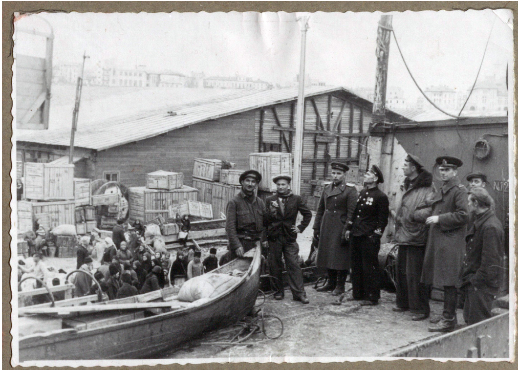
Рисунок 20. Офицеры и моряки, руководящие погрузкой