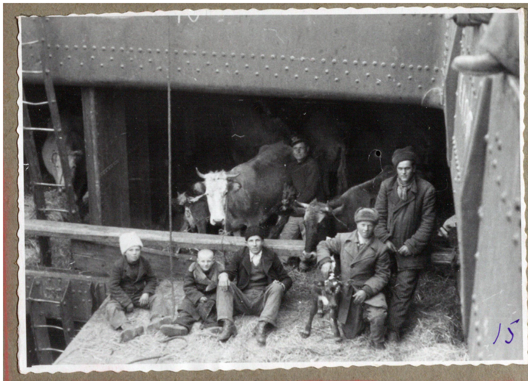
Рисунок 18. Коровы в трюме корабля