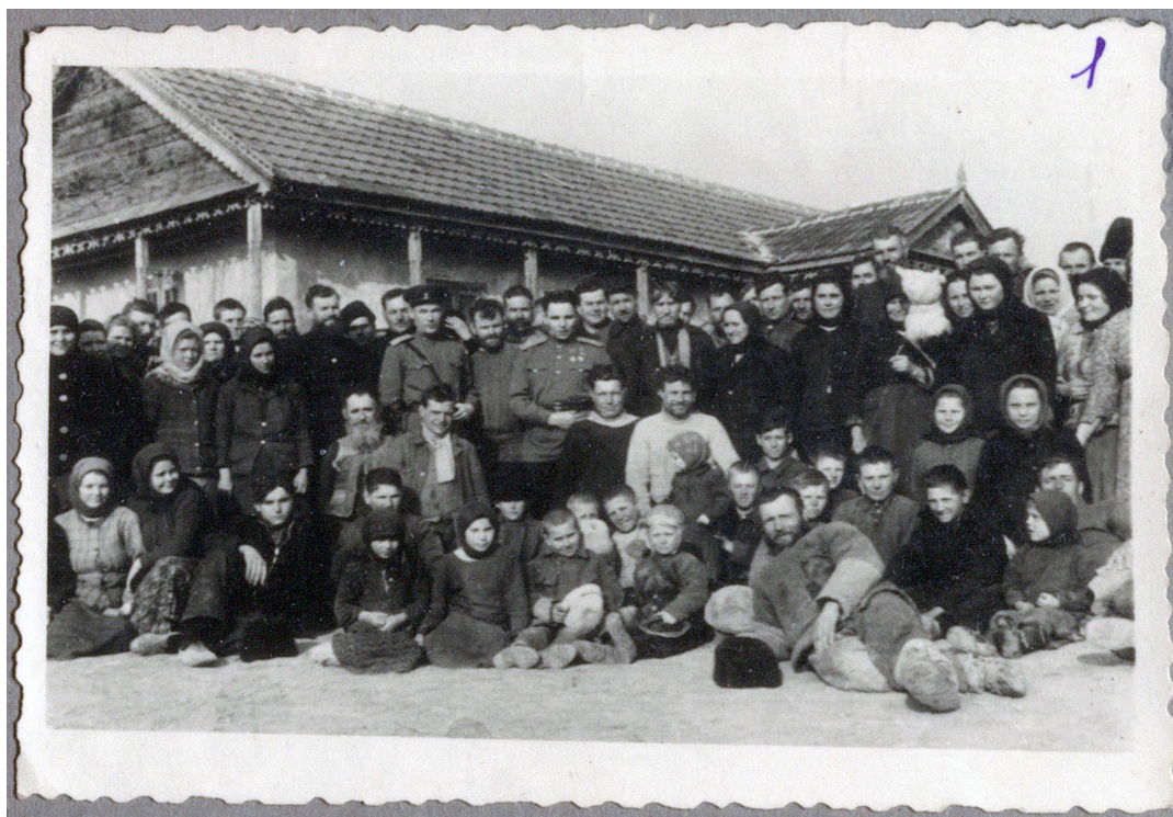
Рисунок 2. «Село Новодар — после проведенной беседы в подготовке к выезду»