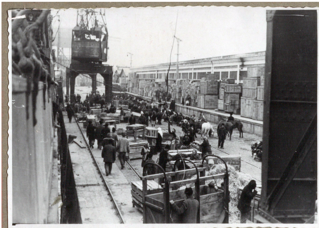
Рисунок 12. Общий вид на пирс перед погрузкой на корабль