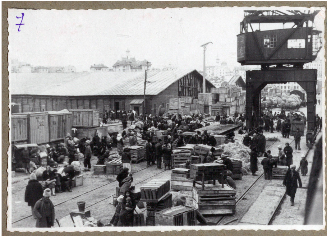
Рисунок 8. Люди и их вещи на пирсе Констанции перед погрузкой