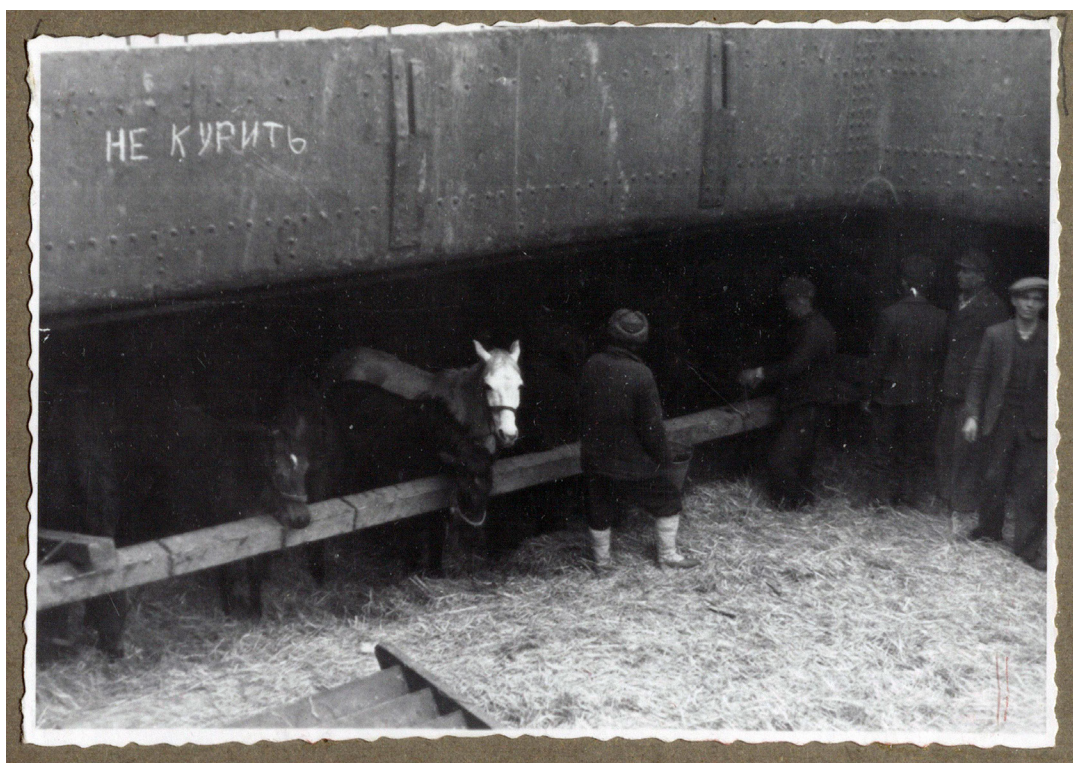
Рисунок 19. Кони в трюме корабля