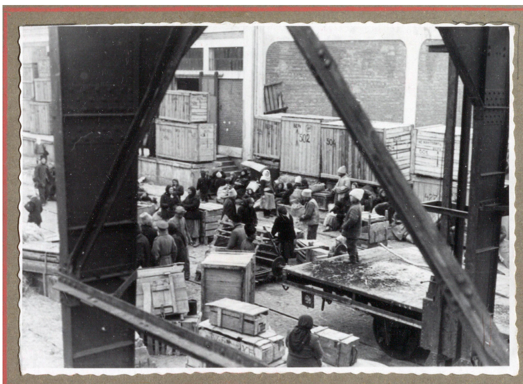
Рисунок 11. Старообрядческие семьи в ожидании погрузки