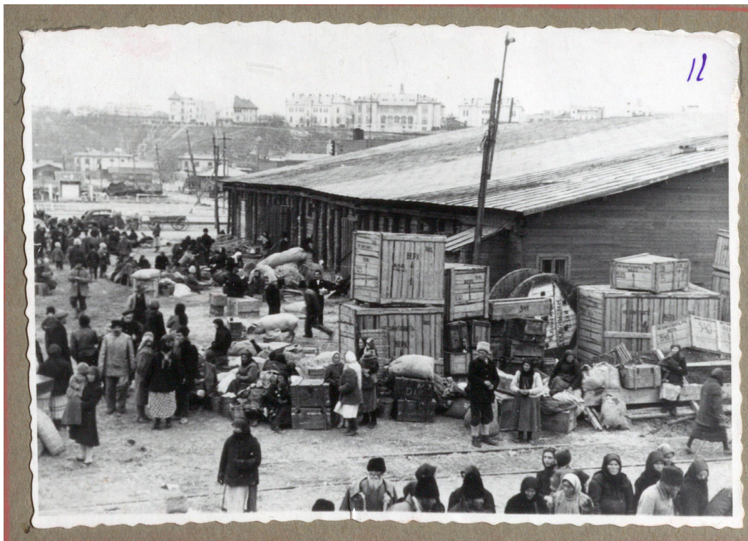
Рисунок 14. Общий вид на пирс перед погрузкой на корабль