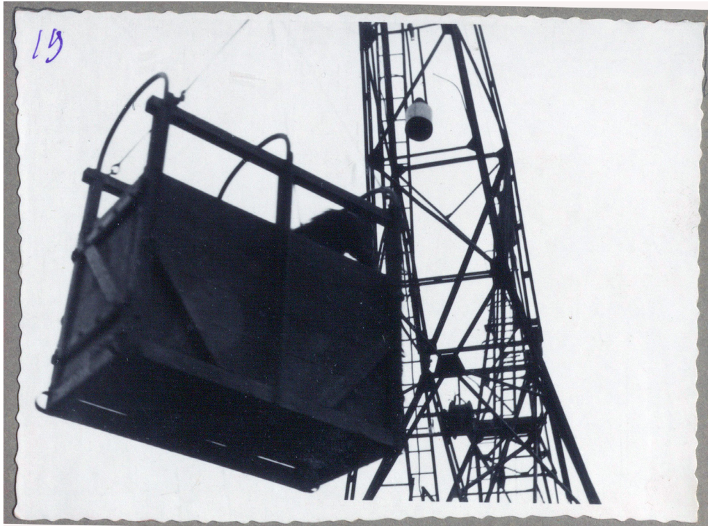
Рисунок 24. Погрузка коня с помощью крана