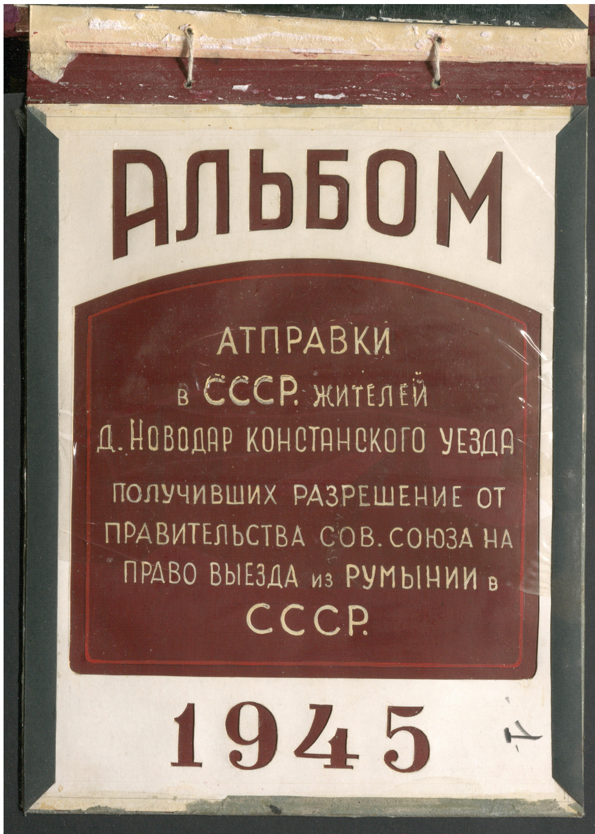
Рисунок 1. «Титульный лист фотоальбома»