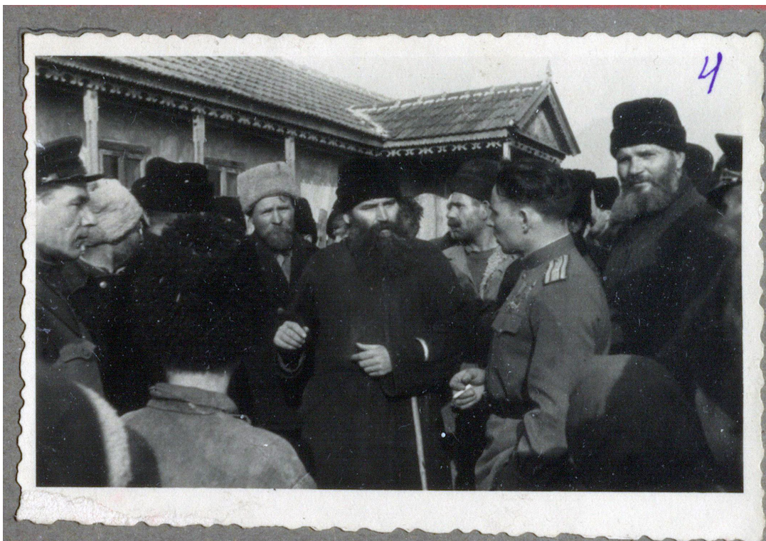
Рисунок 5. «Беседа с Неводарцами»