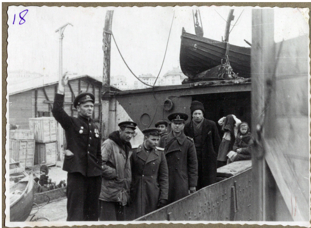
Рисунок 23. Офицеры руководят погрузкой с борта корабля