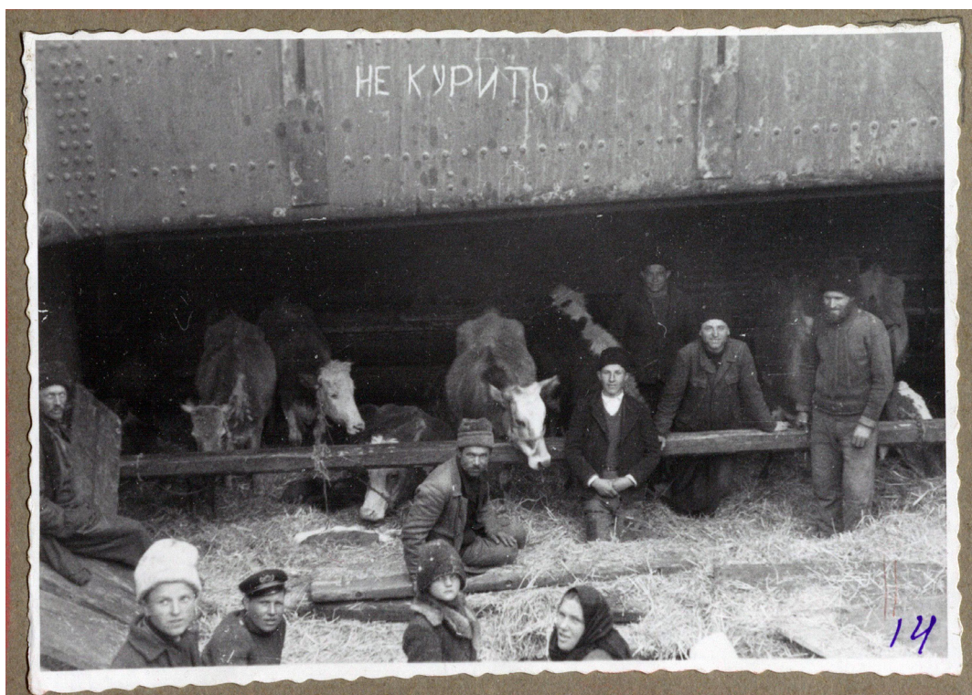
Рисунок 17. Коровы в трюме корабля