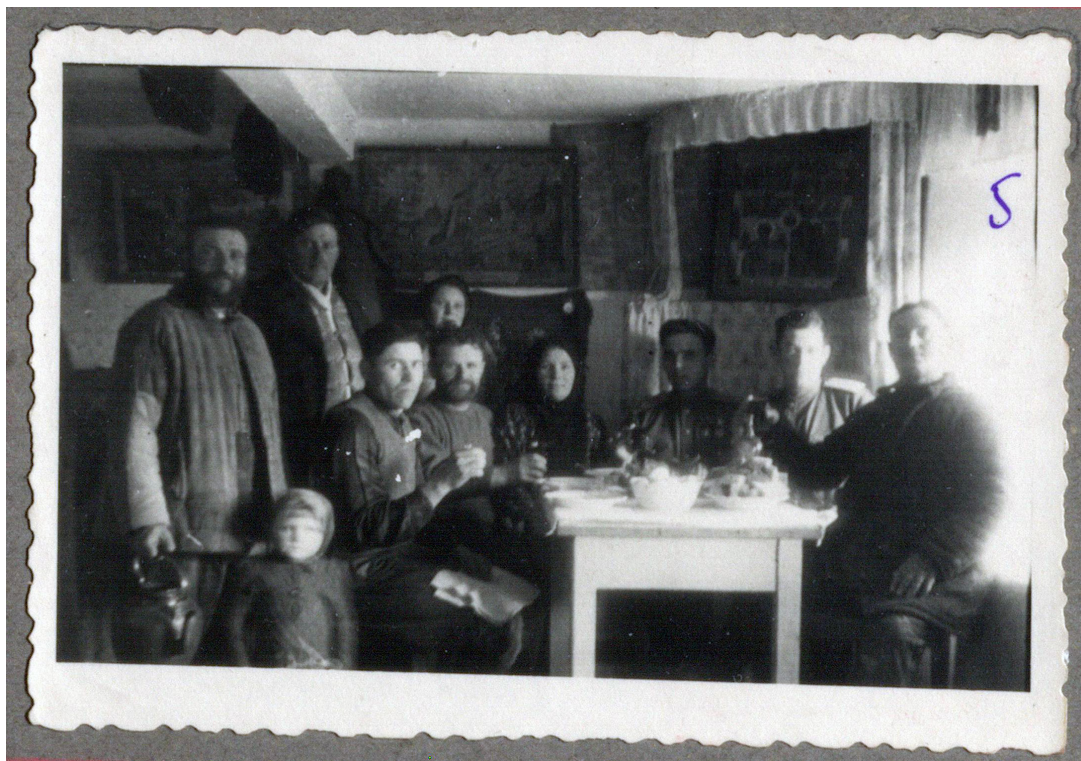
Рисунок 6. «В комнате у старосты; отъезжающие у тов. Осипова с участием бригадиров только-что выбранных на общем собрании».