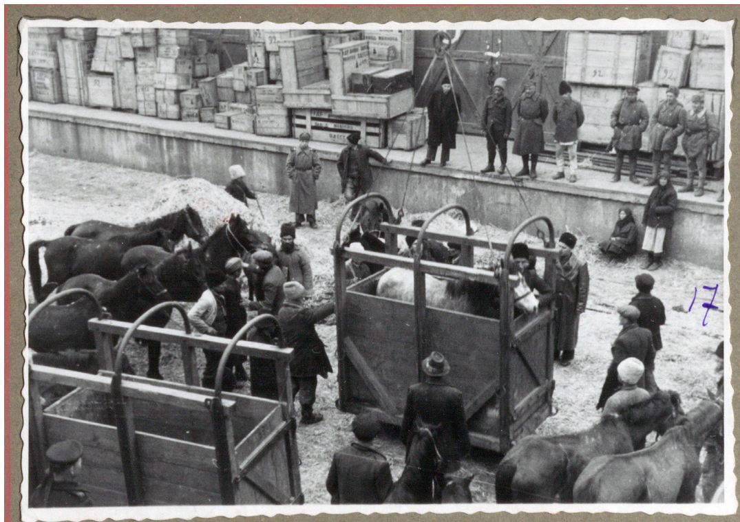
Рисунок 22. Момент погрузки коней в специальные кораба на пирсе