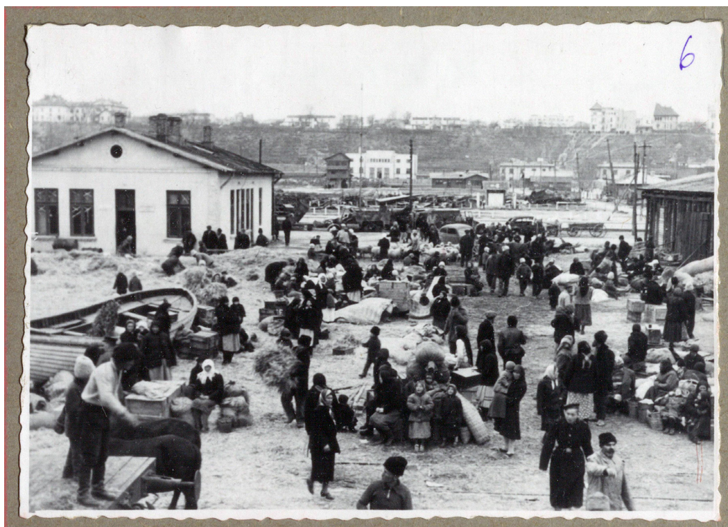
Рисунок 7. Липоване и их пожитки в порту Констанца