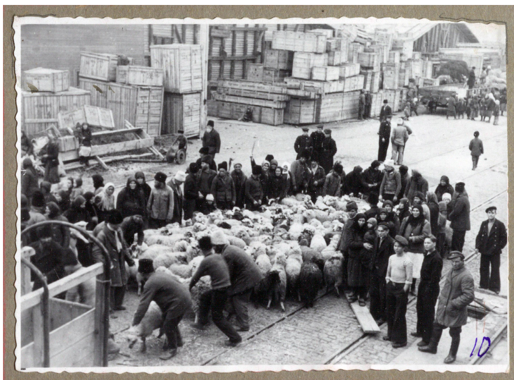
Рисунок 13. Липованская отара овец в окружении людей на пирсе