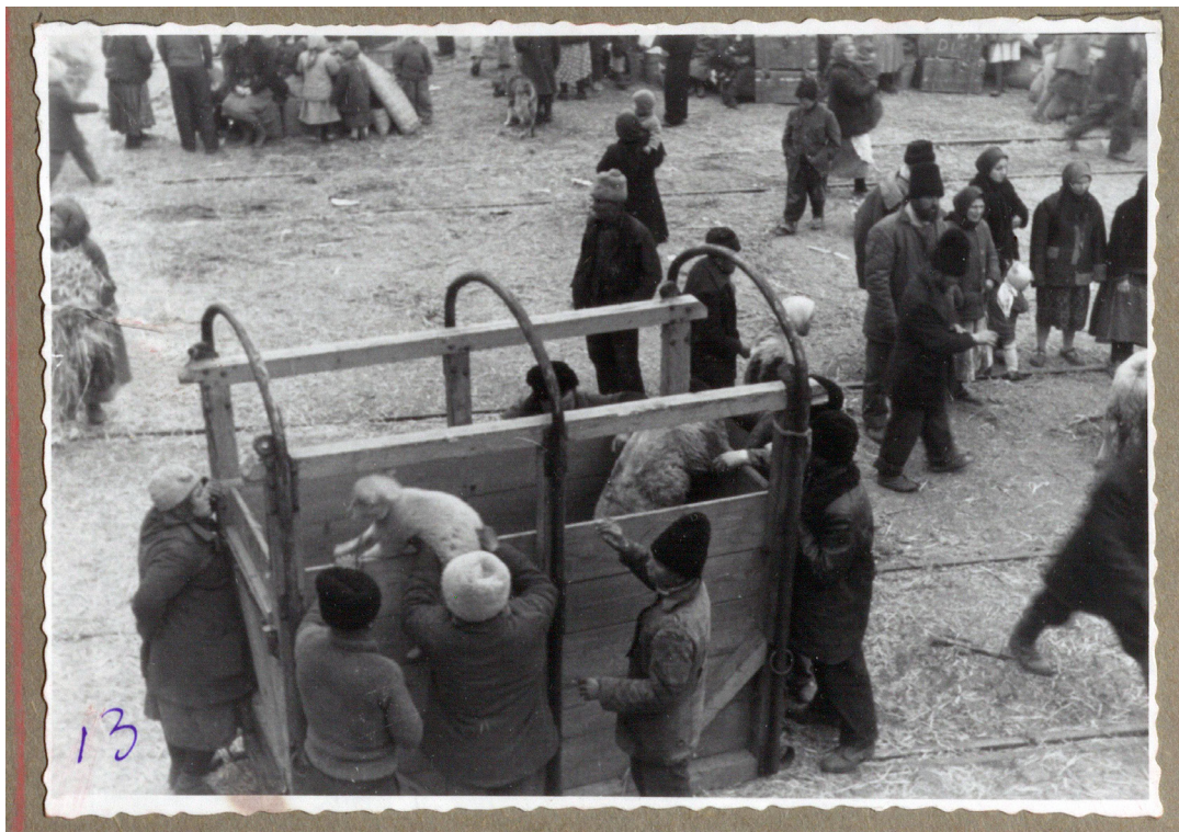
Рисунок 16. Эпизод погрузки овец в специальный короб на пирсе