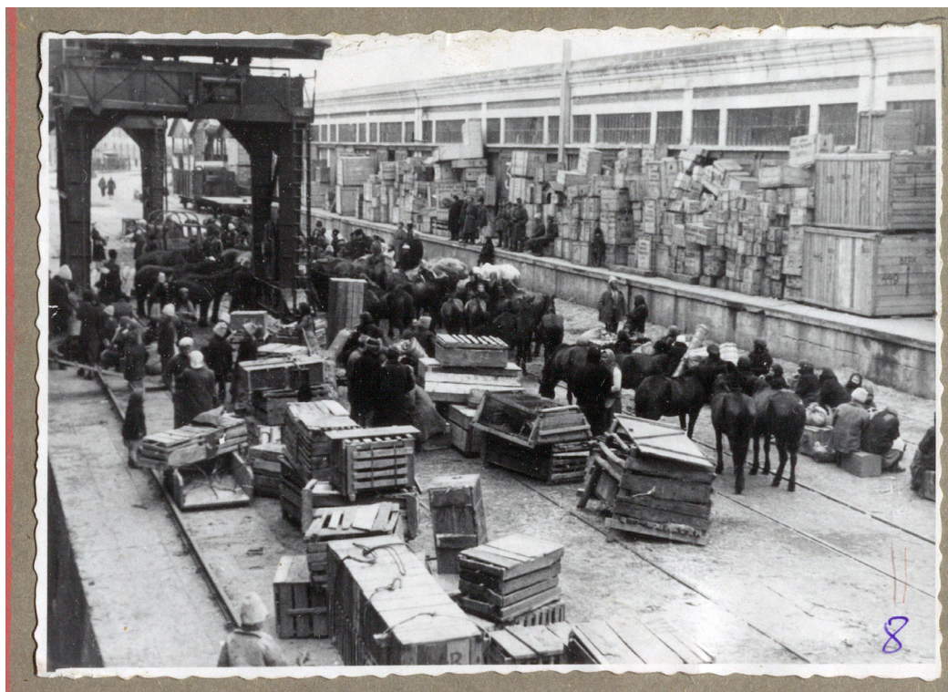
Рисунок 9. Люди, кони и вещи на пирсе Констанции перед погрузкой