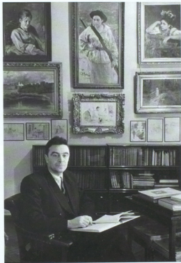
Известный коллекционер, меценат и литератор И. С. Зильберштейн в своем кабинете в ЦГА.ВК, 1960-е гг.