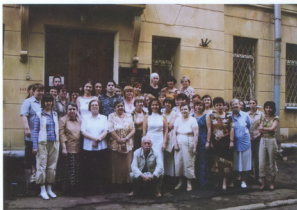
Коллектив РГАЛИ в год празднования 65-летия архива, 2006 г.