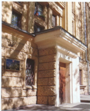
Гостеприимные двери архива сегодня