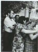
Экскурсия по Рязани, экскурсовод А. И. Солженитин, 1965 г.