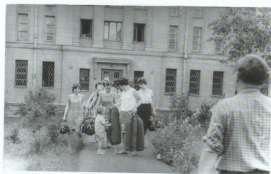
Сбор сотрудников у арки в путешествие по древним городам России, 1966 г.