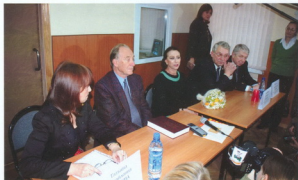
Посещение архива для пополнения личных фондов Р. К. Щедриным и М. М. Плисецкой, 2014 г.