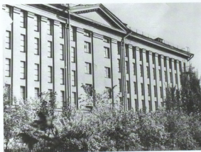
Здание центр. ШАЛР, 1960-е гг.