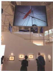
Экспозиция выставки «Эстетический глаз. Эпизоды, коллажорграфист на перекрестке искусства» в Центре Помпиду-Мед, 2019 г.