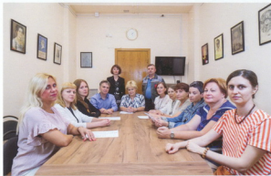
На заседании дирекции архива. 2021 г.