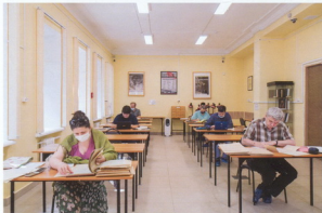
Читальный зал РГА/ЛИ, современное фото