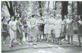
Поездка сотрудников в Эстонию, 1965 г.