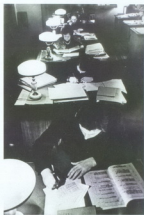
Читальный зал ЦГА/ЛИ, 60-е гг. XX в.