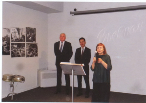
Открытие выставки «Точка назначения – Выставка», 2019 г.