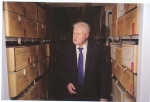
Посещение РГАЛИ руководителем фракции «Справедливая Россия» в Госдуме РФ С. В. Мироновым. Октябрь. 2020 г.