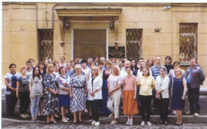
Общая фотография сотрудников РГАЛИ в год 80-летия архива, август 2021 г.