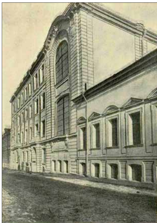
Главный фасад гимназии имени Ивана и Александры Медведниковых. Староконюшенный переулок.