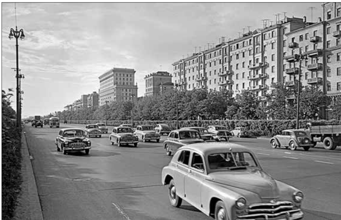
Ленинградский проспект. 1958 год