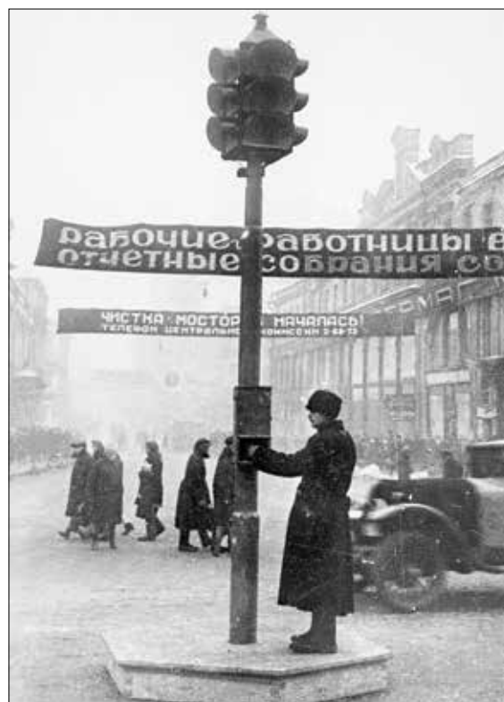
Первый московский светофор