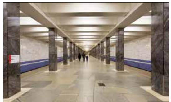
Станция метро «Водный стадион»

Открылась станция Московского метрополитена «Водный стадион». Название дано по находящемуся рядом на Химкинском водохранилище водному стадиону «Динамо».